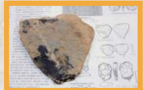
広島県帝釈・観音洞 板状石核 厚2.7cm