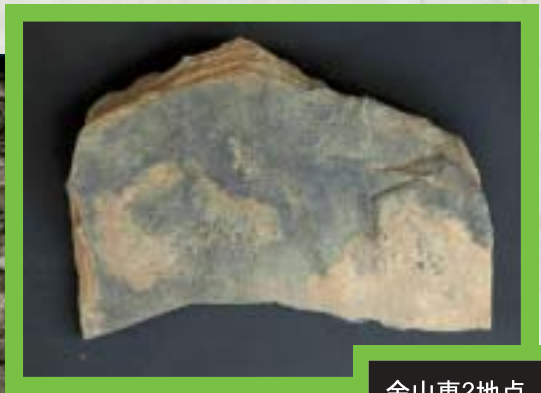
金山東2地点 板状石核 厚3.82cm