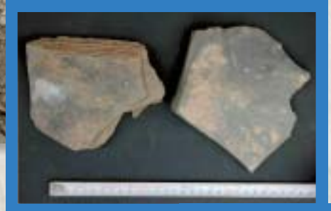
金山東2地点 板状石核 厚2.45 厚2.6cm