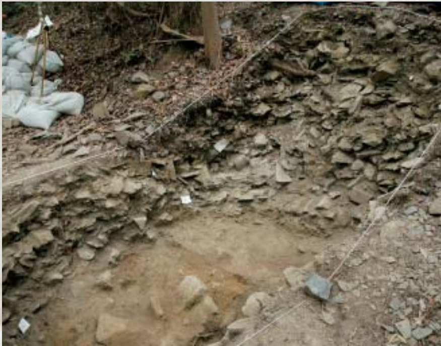
金山東2地点の発掘調査 2008年8月